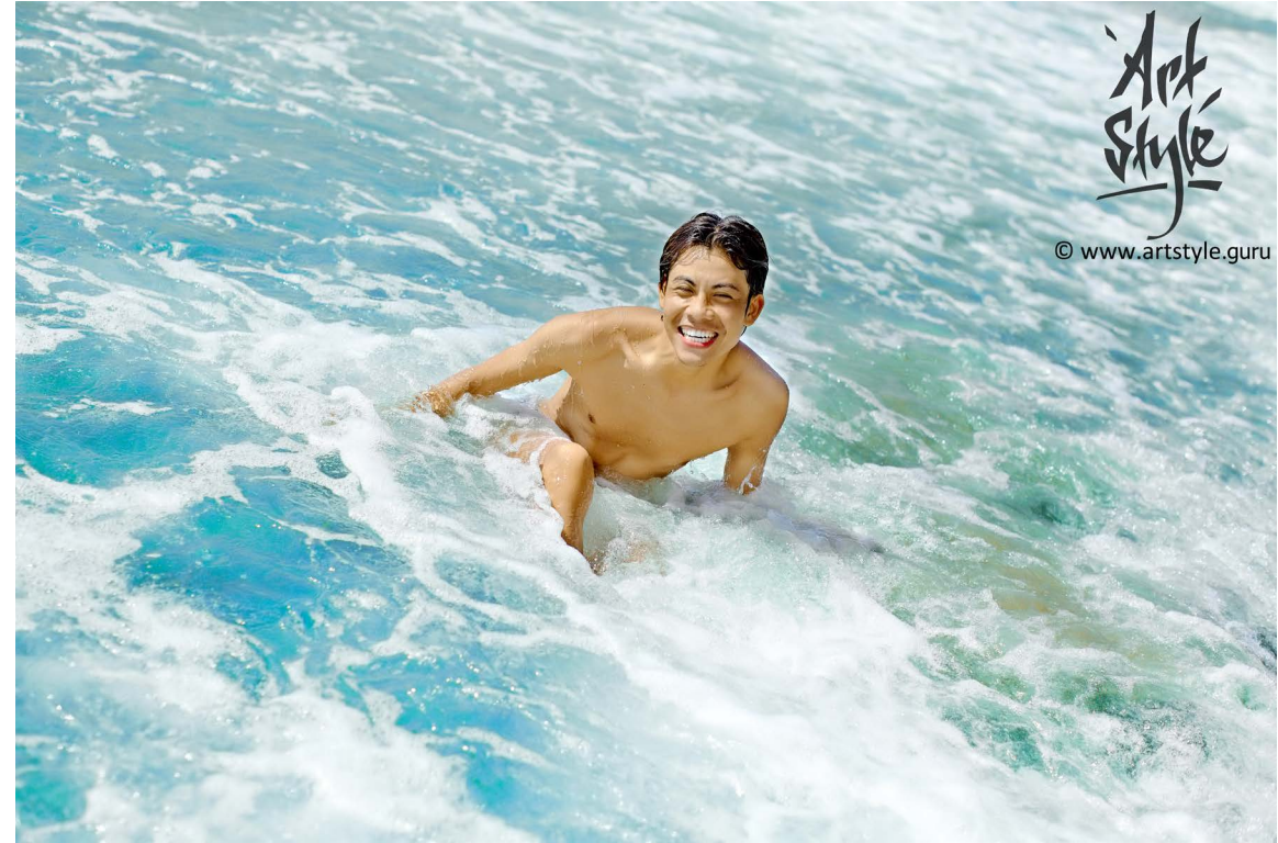
Снимок, обработанный в Capture One.

Периодически бывают моменты, когда море и небо во время съемок - ну никак не синие.