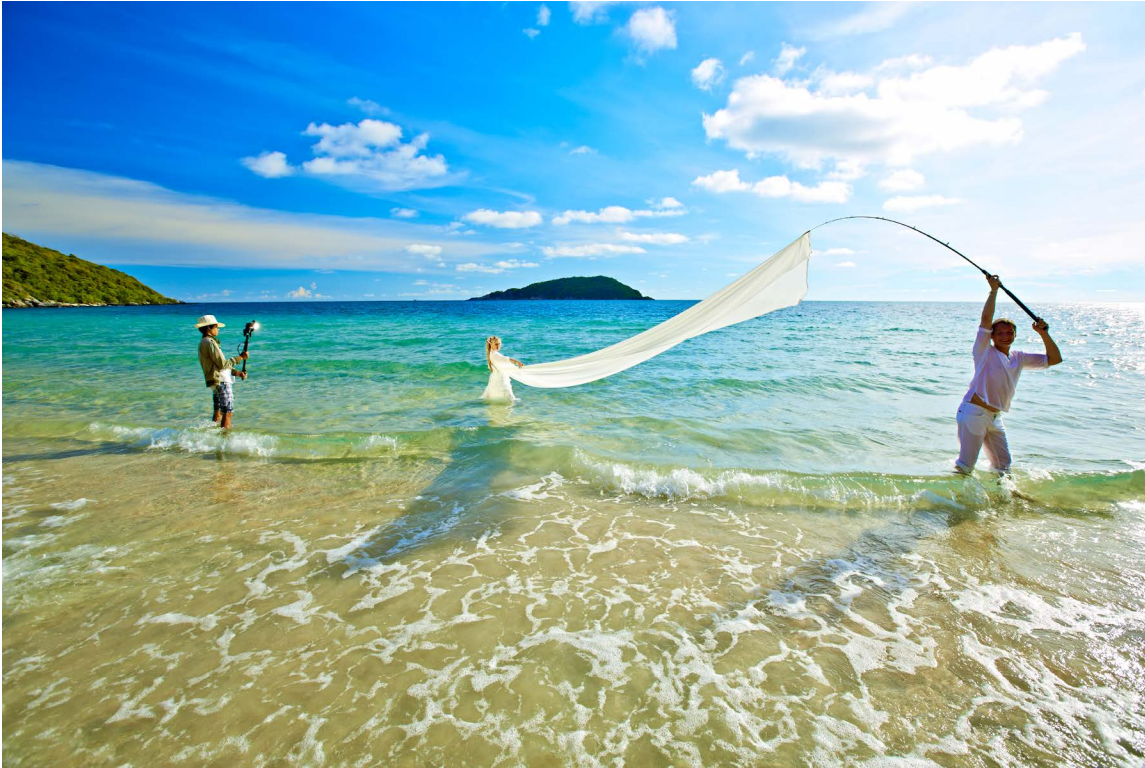
Реальный вид с места съемок