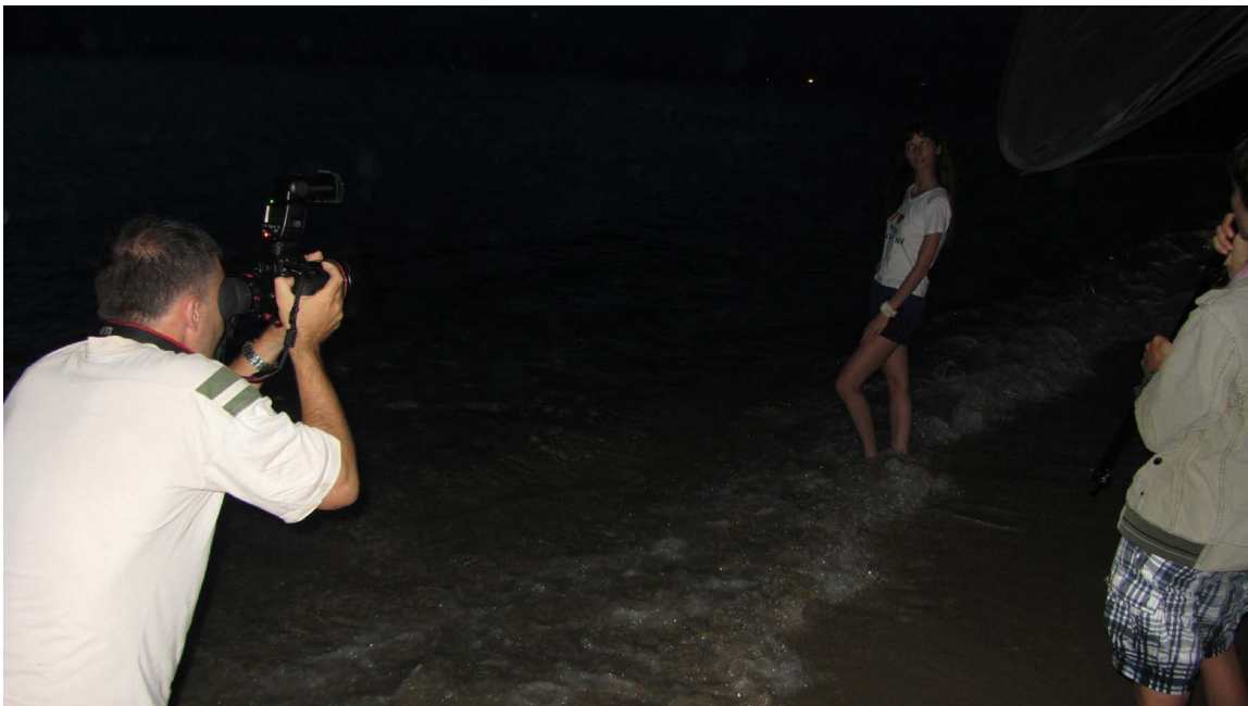
Реальный вид с места съемок