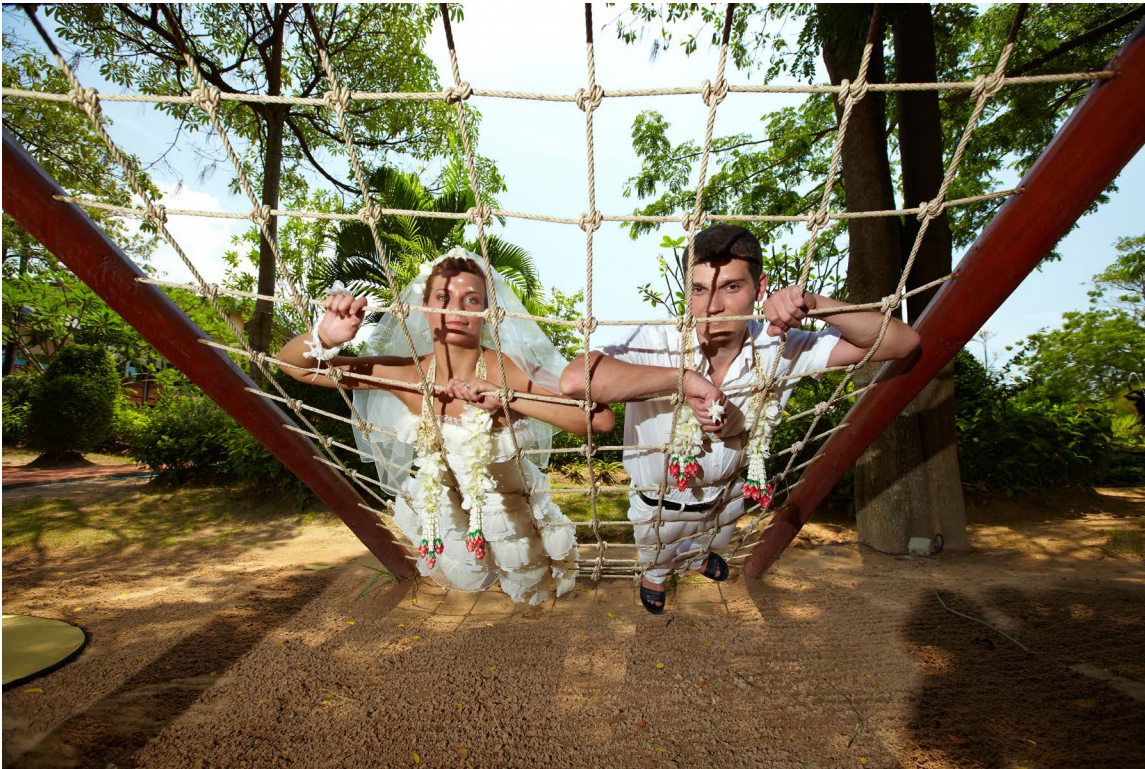
Canon EF 16-35/2.8 L II, вспышка