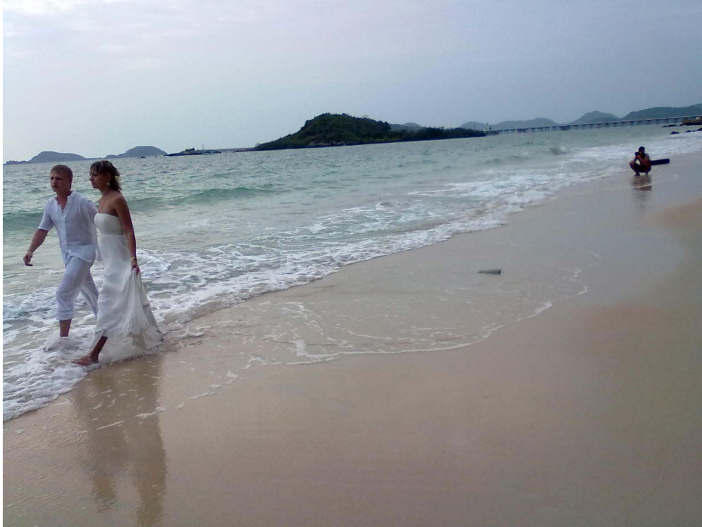
Реальный вид места съемок.