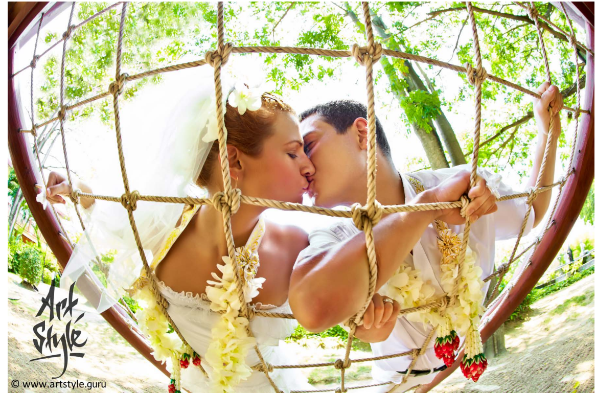
Canon EF 15/2.8 fisheye, золотистый отражатель

При наличии интересного сюжета очень важно выбрать верную оптику для получения выразительного кадра. Со знанием дела подобранный для нужного эффекта объектив позволит обыграть сюжет на все 100 %.