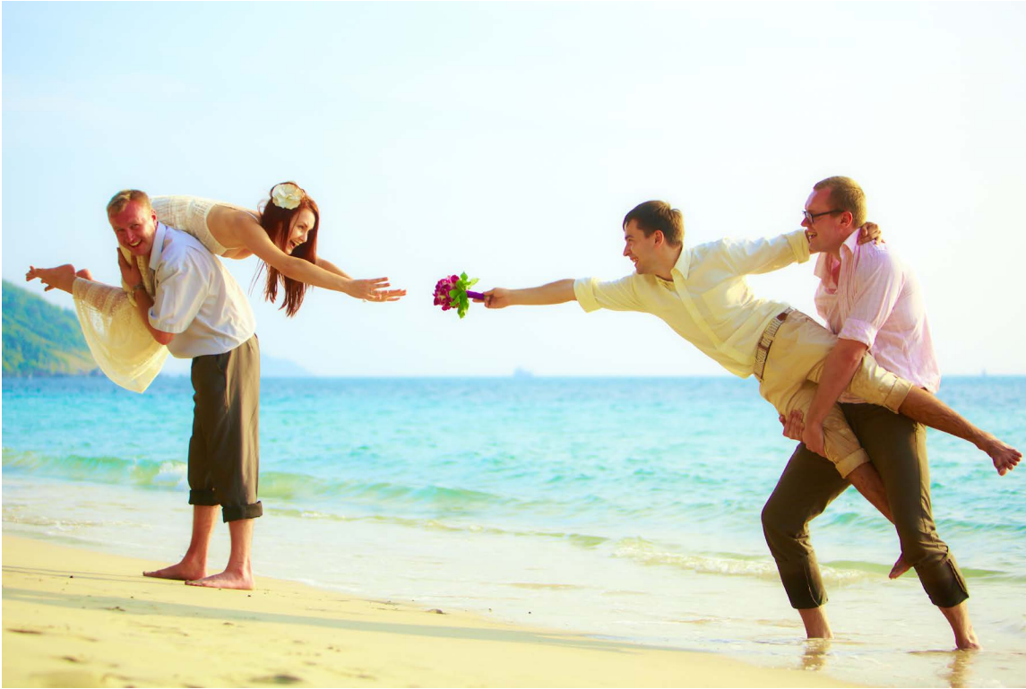
Реальный вид с места съемок