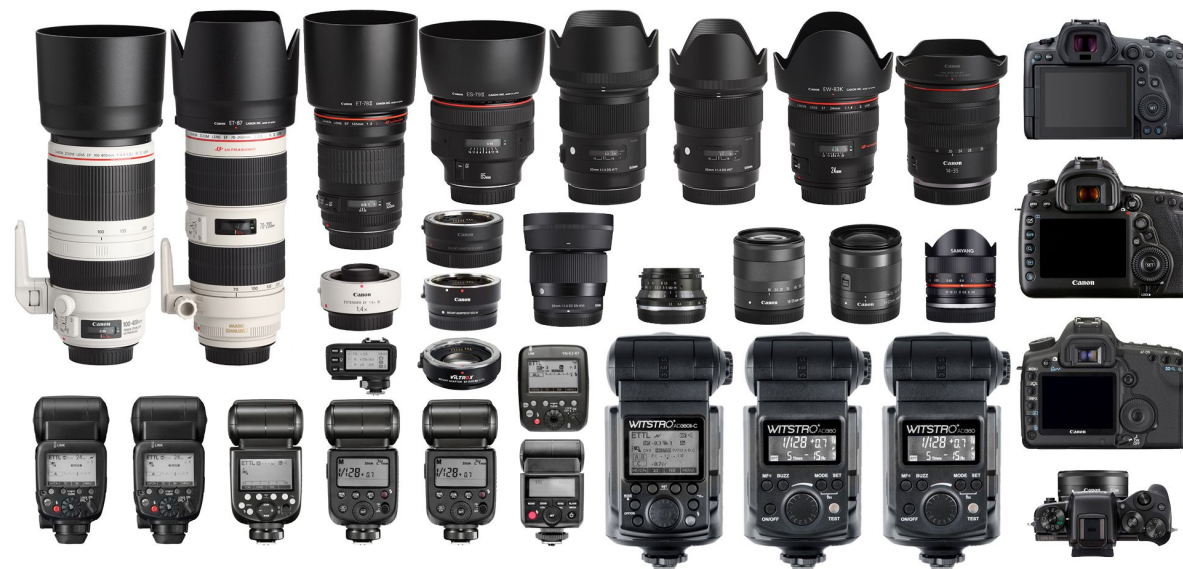
Используемое мной на съемках фотооборудование.

Легальная работа в Таиланде. Даёт возможность работать, не вызывая проблем с законом и не подвергая себя и своих клиентов риску быть задержанными иммиграционной полицией, а так же работать с юридическими лицами и по безналичному расчёту.