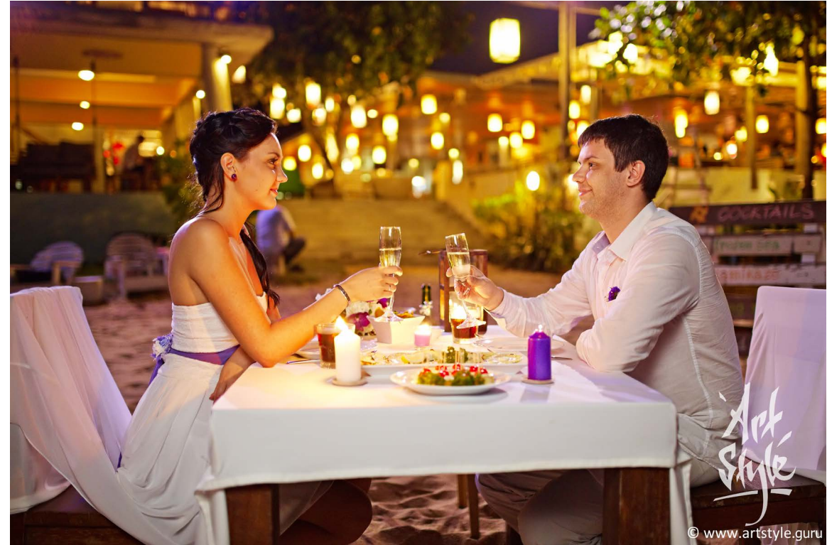
Профессионал 1/25c, f/1.4, 1250ISO

После захода солнца наличие у фотографа хороших светосильных объективов особенно важно. При их отсутствии кадр не спасает даже наличие внешних вспышек. Умело используя необходимый светосильный объектив, хороший фотограф максимально сохранит на фото атмосферу и эмоции праздничного момента.