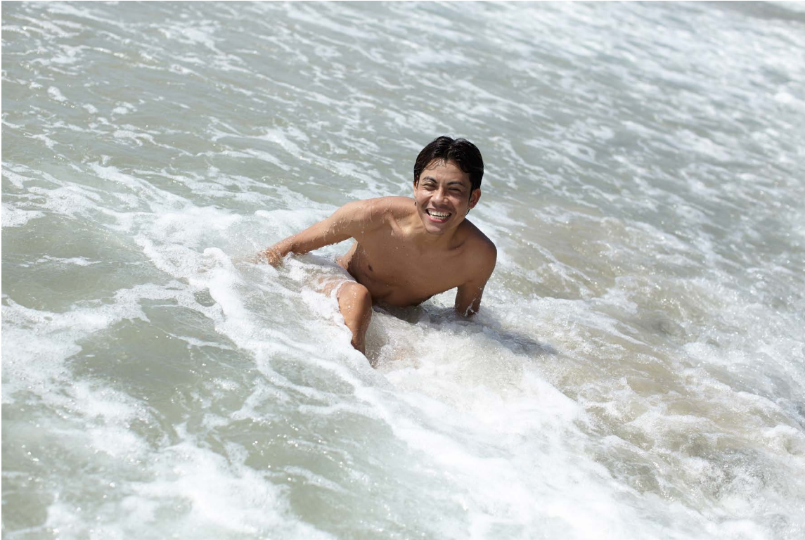
Снимок, сохраненный камерой.